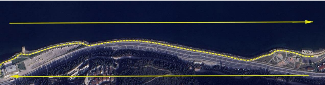
Koşu Parkuru – Plaj sahil yolu (1 tur 800m.)