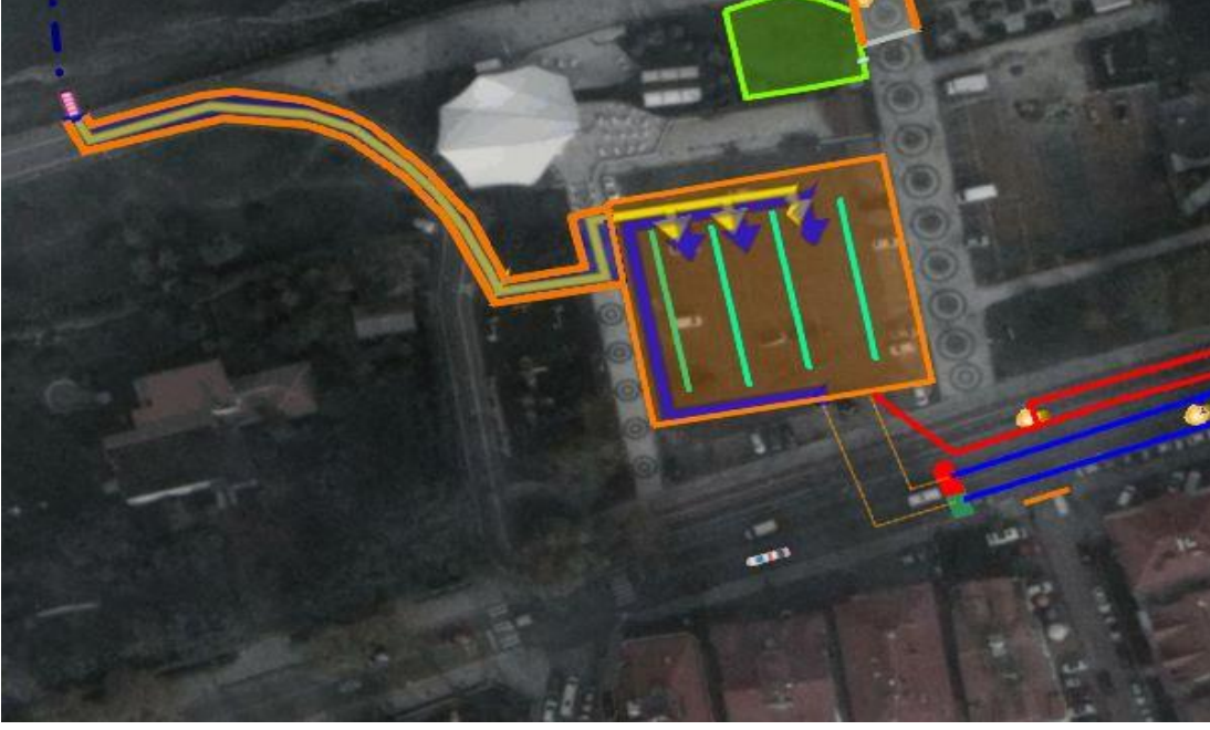
Değişim Alanı 1 ve 2 (Sarı Oklar: T1, Mavi Oklar: T2)